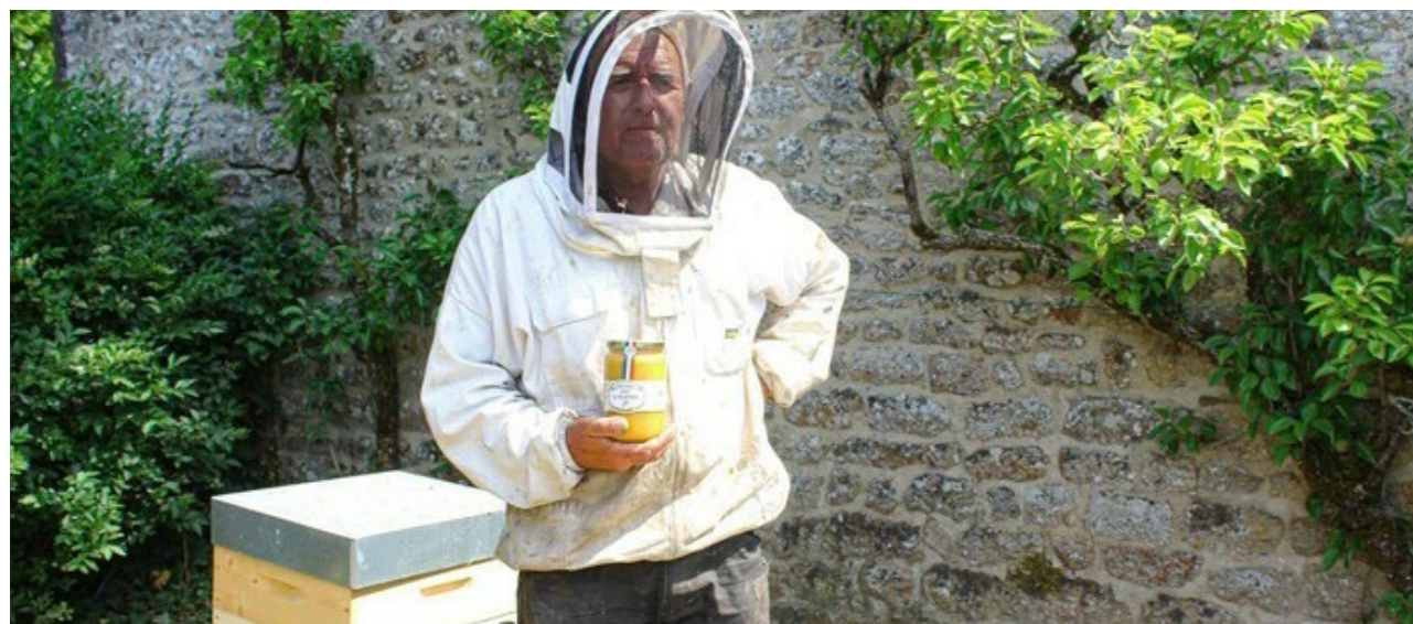
Le Manoir des Abeilles

Mercredi 9 octobre de 14h à 17h Sur inscription : 02 33 48 60 57 Le Manoir des Abeilles, parc d'activité du mont Saint-Michel 50170 Pontorson www.manoir-des-abeilles.com