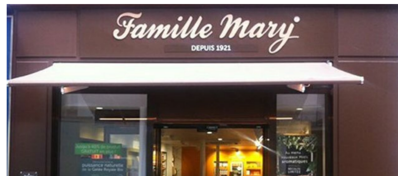
Boutique Famille Mary Saint-Germain-en-Laye